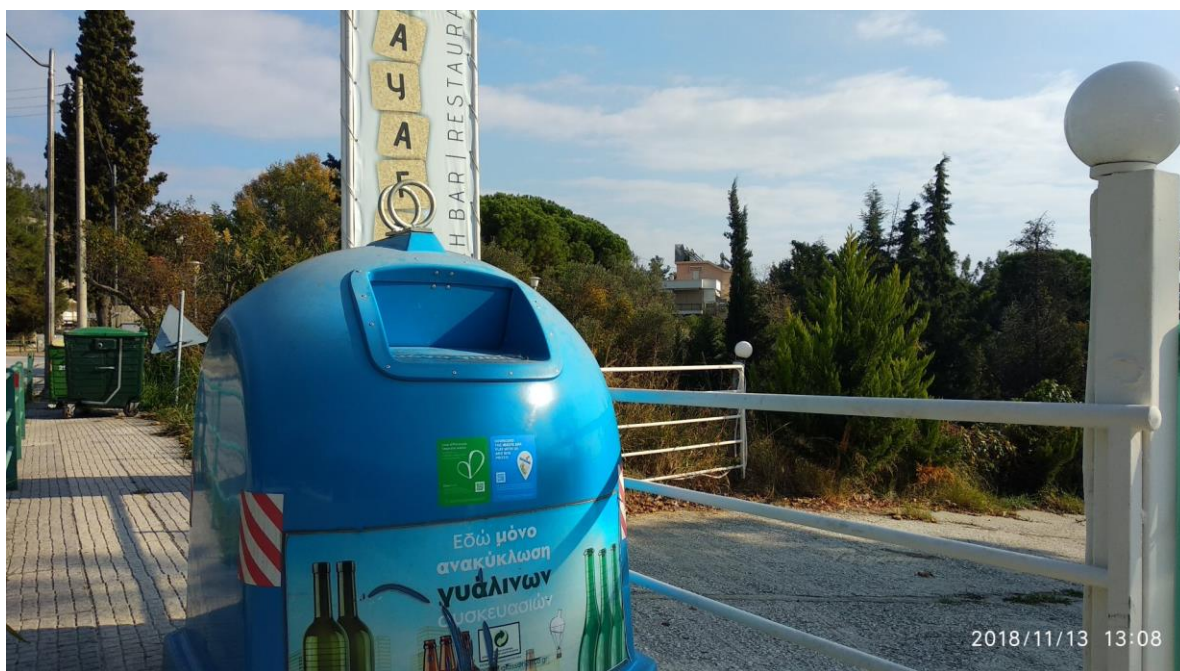
Εικόνα 2: Τα αυτοκόλλητα με τα QR codes του WasteApp και σε κάδους ανακύκλωσης γυαλιού στην Καβάλα.